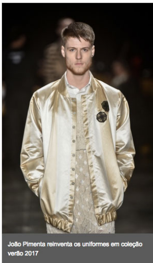
João Pimenta reinventa os uniformes em coleção verão 2017

João Pimenta apresentou, na noite desta quinta-feira (28), dentro da programação da São Paulo Fashion Week, uma coleção focada na temática militar.